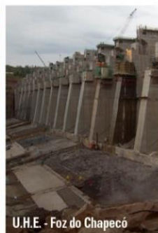
U.H.E - Foz do Chapecó