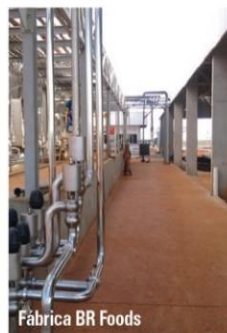
Fábrica BR Foods