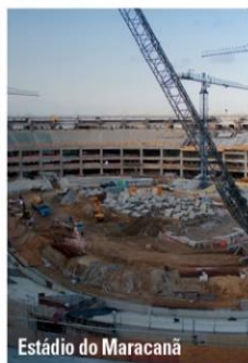
Estádio do Maracanã