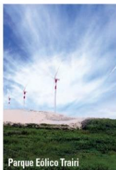
Parque Eólico Trairi