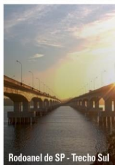
Rodoanel de SP - Trecho Sul