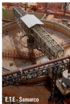
E.T.E - Samarco