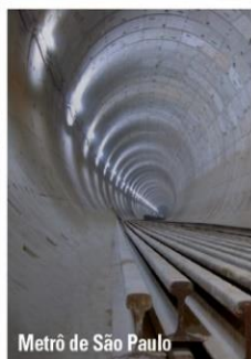
Metrô de São Paulo